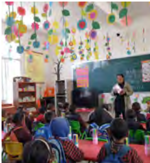
幼儿班课堂上认真听讲的孩子