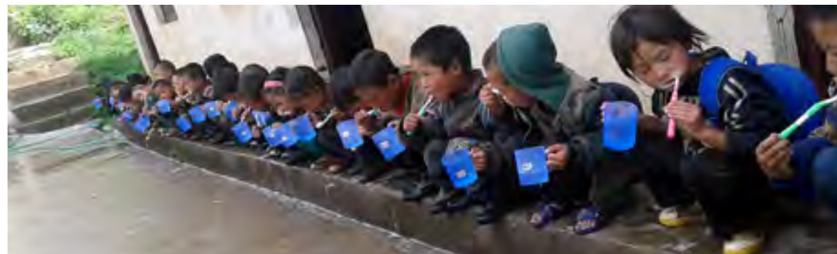
培养卫生习惯养成好身体