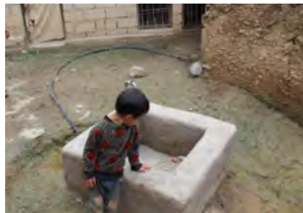
接入农户家的水池