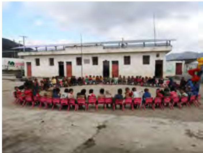
波浪幼儿班的孩子们在做户外活动