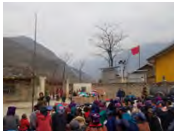
给村民们发放衣物