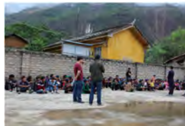
村民饮水、卫生知识培训